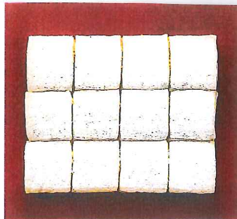
Una delle opere di Manzoni all'incanto a Milano

portanza due "Nature morte" di Filippo De Pisis, un Renato Paresce del 1926 e tre rarissimi dipinti di Giorgio De Chirico: "Lepre e pernici" del 1923, appartenuto al suo mercante e collezionista fiorentino Giorgio Castelfranco; "Busto di donna in verde" del 1924 e "Achille e Chirone" del 1938. Di Mario Sironi, in asta un magnifico "Paesaggio urbano con ferroviere" dei primissimi anni '20. Tra i maestri dell'Avanguardia Italiana del Secondo Dopoguerra compaiono Isgrò, Agnetti, Mauri, Baruchello, Parmiggiani e Boetti e Manzoni.