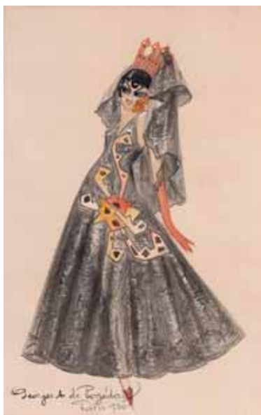
81 Georges De Pogedaieff Anatolevich (Yalta 1894 - Ménerbes 1971)

В послевоенный период и до конца 1950-х годов, выставки работ