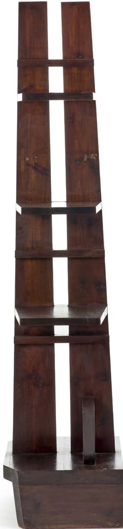
vista laterale del lotto