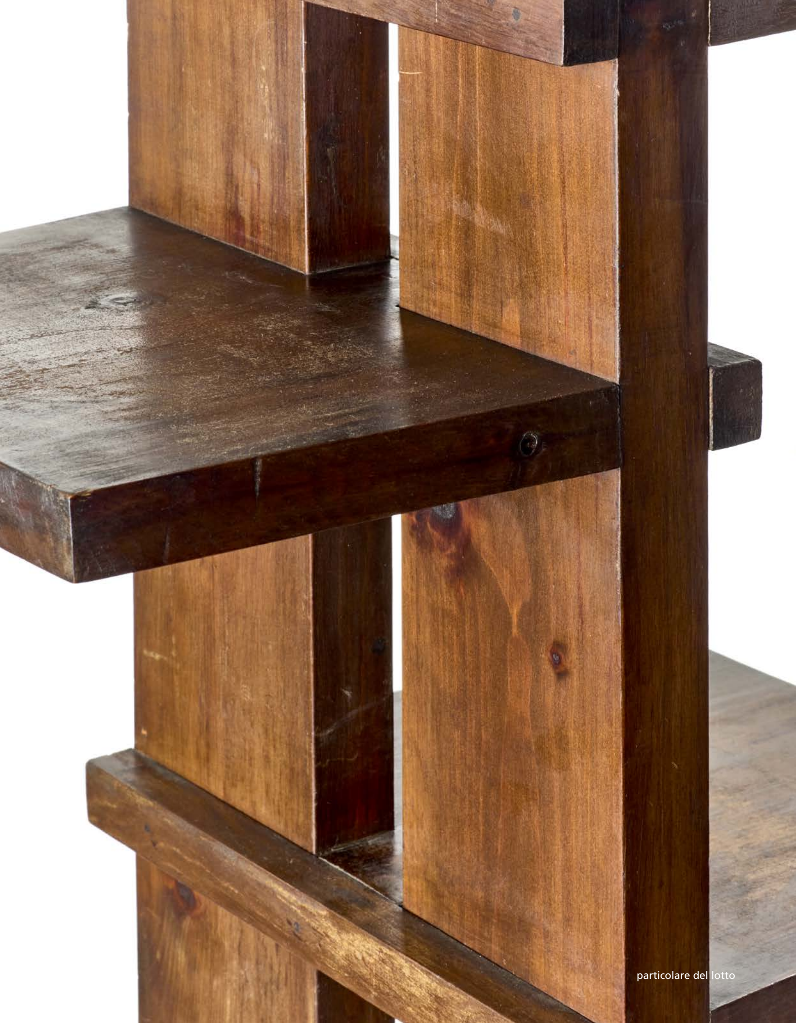
particolare del lotto