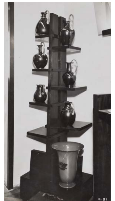
Sala Cappellin e C. IV Triennale di Monza, 1930