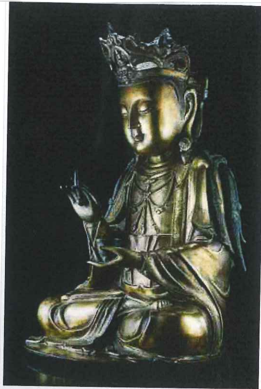
Lotto 678 -Grande Guanyin in bronzo dorato, in posizione dhyanasana, Cina, dinastia Ming, XVIIsec Valutazione 60.000,00 – 80.000,00€ – Venduto 243.750 €

La migliore performance è stata raggiunta dalla Grande Guanyin in bronzo dorato (52 cm.h), Cina, dinastia Ming, sec. XVII proveniente da una collezione privata milanese valutata 60.000/80.000 € e venduta a 243.750 €.